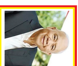
Eddy Sugianto Kekayaan: 1,27 miliar USD Sumber: Logam & Pertambangan