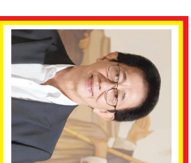
Inwan Hidayat Kekayaan: 1,35 miliar USD Sumber: Perawatan Kesehatan