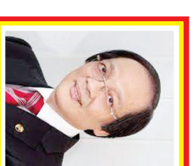
Sudhanek Agoeng Kekayaan: 1 miliar USD Sumber: Makanan & Minuman