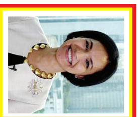
Arini Subianto Kekayaan: 1,5 miliar USD Sumber: Logam & Pertambangan