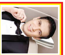
Manoj Punjabi Kekayaan: 1,05 miliar USD Sumber: Media & Hiburan