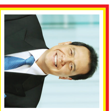
Chairul Tanjung Kekayaan: 5,2 miliar USD Sumber: Diversifikasi