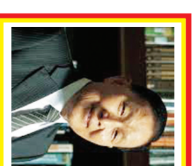
Mochtar Riady Kekayaan: 1,45 miliar USD Sumber: diversifikasi