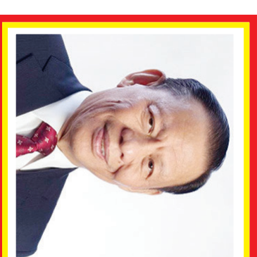
Sukanto Tanoto Kekayaan: 2,9 miliar USD Sumber: Diversifikasi