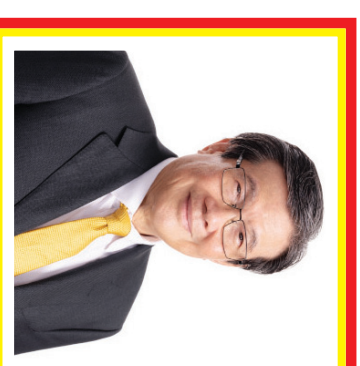
Prajogo Pangestu Kekayaan: 5,1 miliar USD Sumber: Diversifikasi