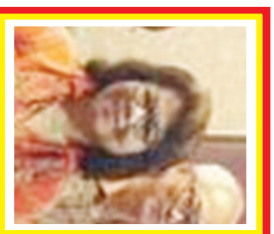
Dewi Kam Kekayaan: 2 Miliar USD