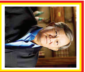
Poetera Sampoerna Kekayaan: 1,7 miliar USD Sumber: Keuangan & Investasi